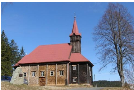
Kaplica NMP Wspomożenia Wiernych na Gruniu

17 października grupa parafian wraz z księdzem proboszczem udała się na wycieczkę w Beskid Śląsko – Morawski. Głównym celem naszej wycieczki było zwiedzenie Wałaskiej Ścieżki w Przyrodzie na przełęczy Pustevny. Miejsce wzięło nazwę od pustelni i pustelników, o których krążą liczne opowieści i legendy.